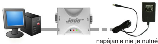
Obrázok 1.1 Zapojenie JODO a PC

UPOZORNENIE: Ak je JODO napájané cez komunikačný konektor (USB alebo COM) tak nie je potrebné používať dodaný 5V adaptér. K zariadeniu JODO musí byť používaný iba adaptér dodávaný s JODO! Použitím iného adaptéra môže dôjsť k poškodeniu zariadenia a zároveň k strate záruky!